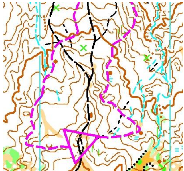
Antrenament special: Drum obligatoriu (PC sunt amplasate de-a lungul drumului obligatoriu)

Antrenament special: Culoar (PC sunt amplasate de-a lungul culoarului)